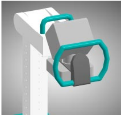
DETALLE DEL CABEZAL MONOBLOCK

Equipo radiológico liviano de 30 mA y 90 kV Alta Frecuencia, para uso en terapia intensiva, internación, quirófanos, unidades de emergencia y veterinaria.