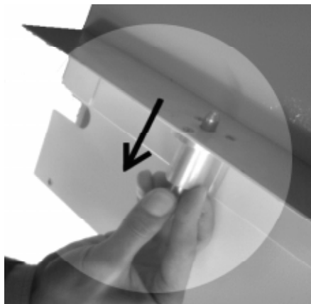
SISTEMA DE SUJECIÓN EN UN SOLO PASO.